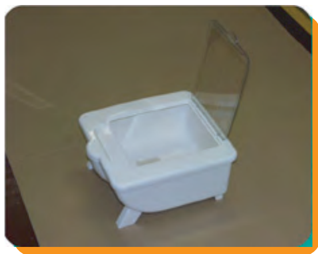
お米取り出し方法モデル図